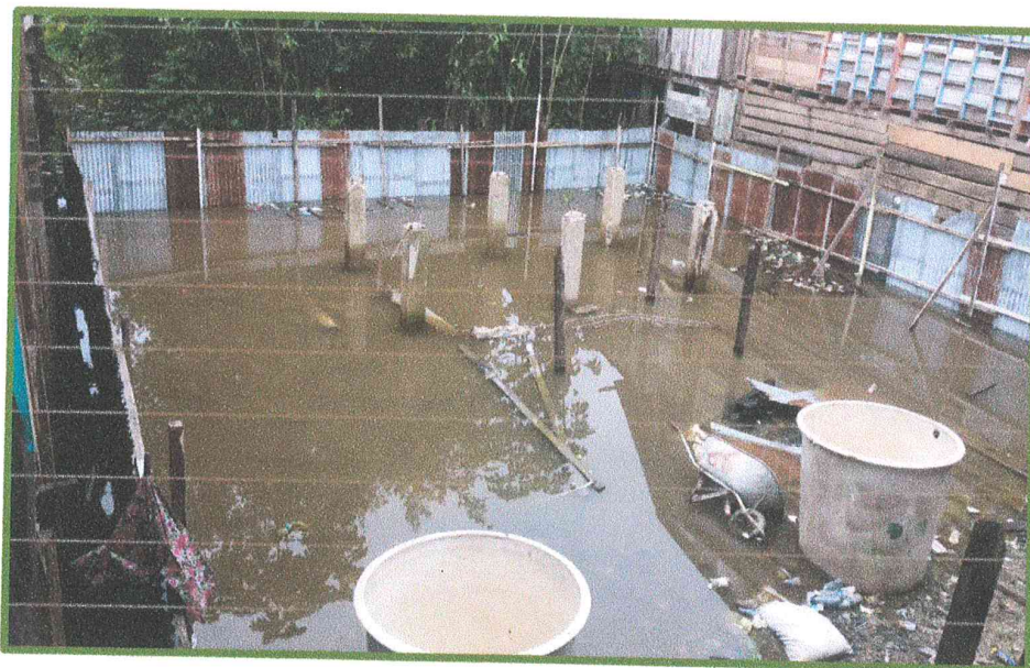
Imagen del 13/01/2020 : El área de terreno destinado a la obra de contingencia se encuentra cubierta de agua en su totalidad, por el progresivo incremento del nivel de creciente del Río.