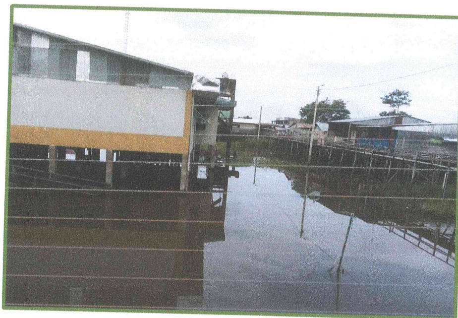
Imagen del 13/01/2020: El área de terreno destinado a la obra de Construcción del Centro de Salud, se encuentra cubierta de agua en su totalidad, por el incremento constante del nivel de creciente