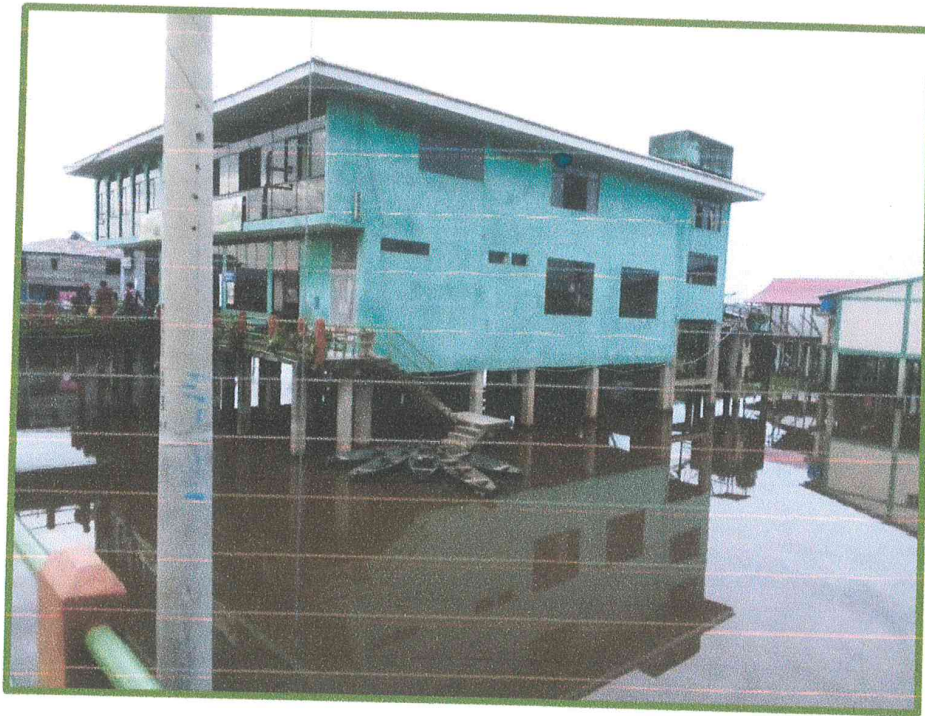
Imagen del 15/01/2020 : continúa la inundación por incremento progresivo del nivel del río Yavarí.