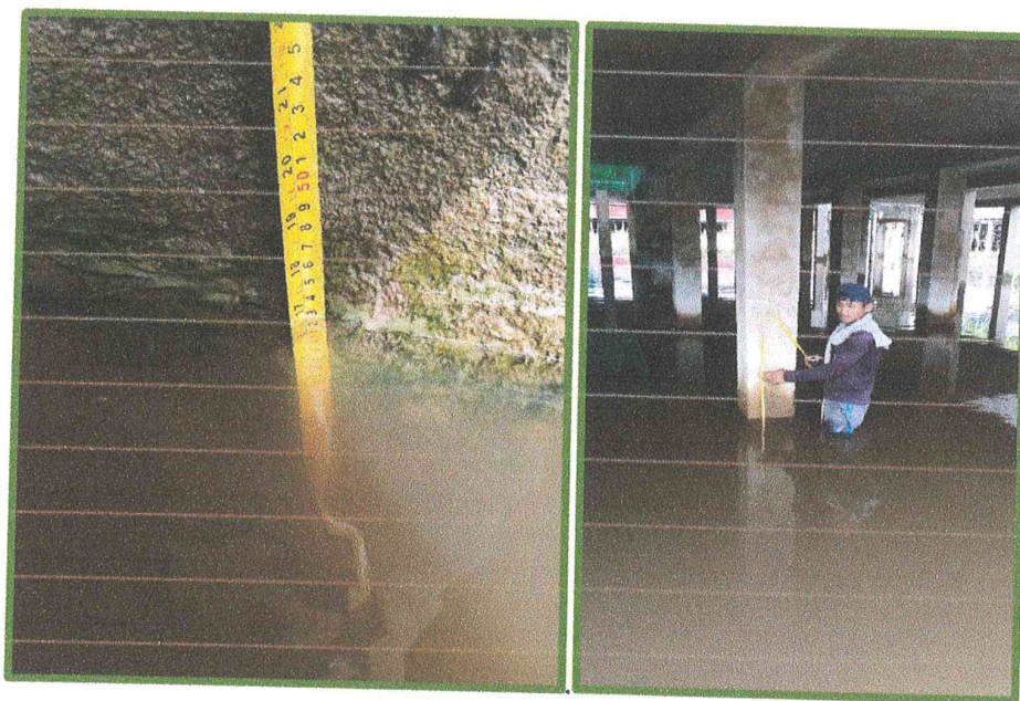
Imagen del 14/01/2020: La localidad de Islandia continúa en proceso de inundación (en la etapa de transición de creciente)