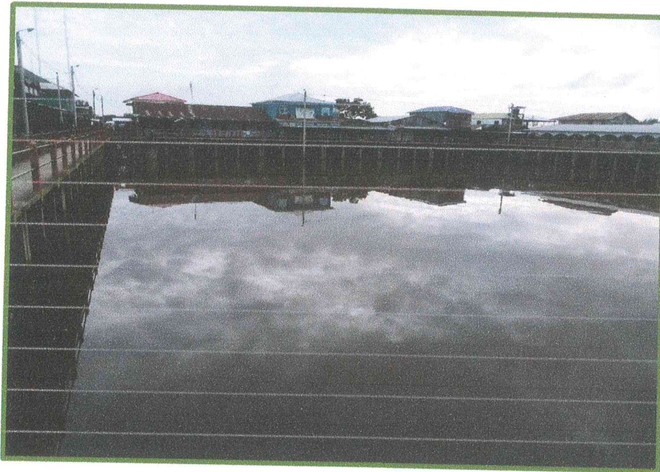
Imagen del 14/01/2020: Centro de la localidad de Islandia, imagen de la evidente inundación