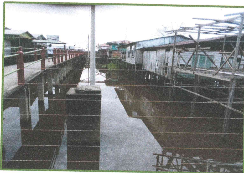
Imagen del 14/01/2020: la inundación por creciente abarcó la totalidad de la localidad de Islandia y continúa en ascenso.